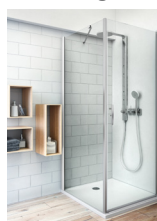
EI PI2 + EI FXP