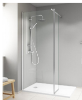
EI TWF + volet mobile EI TWA